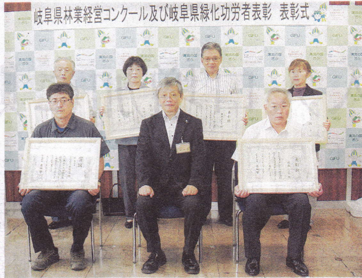
岐阜県林業経営コンクール及び岐阜県緑化功労者表彰 表彰式

本年度の県林業経営コンクールと県緑化功労者表彰の表彰式が二十四日、県庁であり、コンクールは一人と一団体、功労者表彰には三人と二団体が選ばれた。