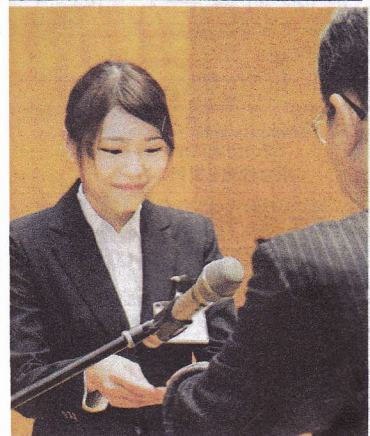
副理事長から決定証書を受け取る奨学生。岐阜市のクラールじゅろうく音楽堂で